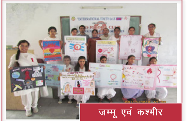
जम्मू एवं कश्मीर