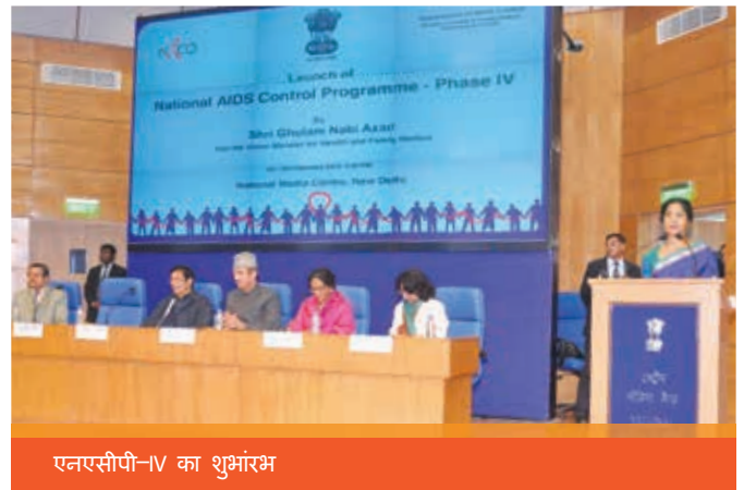
एनएसीपी-IV का शुभारंभ