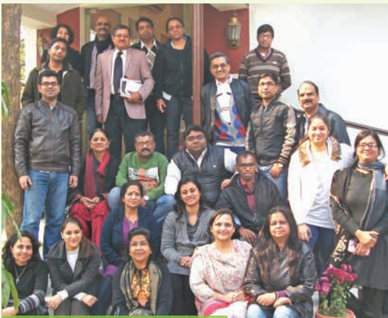
सत्र में भाग ले रहे आईईसी और आईएचबीसी दल के सहभागी

आईएचबीसी की सहायता से जनवरी, 2014 में आयोजित क्षमता निर्माण कार्यशाला में आईईसी प्रभाग के तहत समस्त स्टाफ ने भाग लिया। सचिव, एड्स नियंत्रण विभाग ने कार्यशाला का उद्घाटन किया।