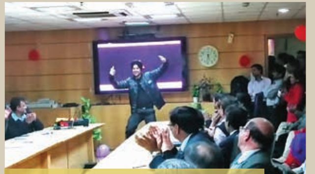
एड्स नियंत्रण विभाग क्लब में नववर्ष समारोह के दौरान भांगडा डांस करते हुए