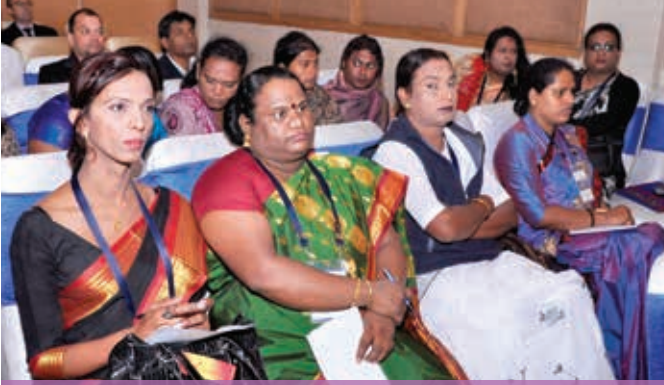
ट्रांसजेंडर और हिजड़ा क्रियाकलापों में विस्तारण के लिए कार्यशाला में दर्शकगण

एड्स नियंत्रण विभाग ने यूएनडीपी की सहभागिता से 5-6 दिसंबर, 2013 को भारत में ट्रांसजेंडर (टीजी) तथा हिजड़ा क्रियाकलापों के विस्तारण हेतु रोड मैप तैयार करने के लिए प्रथम राष्ट्रीय कार्यशाला की मेजबानी की।