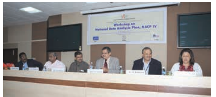
स्वैच्छिक रक्तदान दिवस पर रक्तदाताओं के साथ यूएसएसीएस

एनएसीपी-IV के अंतर्गत राष्ट्रीय डेटा विश्लेषण योजना (एनडीएपी) की शुरुआत एड्स नियंत्रण विभाग में डेटा विश्लेषण और प्रसार इकाई द्वारा की गयी थी। इस योजना की शुरुआत कार्यक्रम के तहत अधिक संख्या में सृजित आंकड़ों का विश्लेषण तथा साक्ष्य आधारित नियोजन और कार्यक्रम प्रबंधन की सहायता हेतु विश्लेषणात्मक रिपोर्ट तैयार करने की दृष्टि से की गई थी। देश के विभिन्न अनुसंधान संस्थानों, मेडिकल कॉलेजों, राज्य एड्स नियंत्रण सोसाइटियों से विश्लेषकों और अनुभवी परामर्शदाताओं का चयन कर लिया गया है। एनडीएपी के प्रमोचन और सभी विश्लेषकों व अनुभवी परामर्शदाताओं को एक साथ एक प्लेटफार्म पर लाने के लिए 16-18 जनवरी, 2014 के दौरान जीपमेर, पुडुचेरी में कार्यशाला आयोजित की गई थी। सचिव, एड्स नियंत्रण विभाग ने विशिष्ट अतिथियों के साथ विदाई समारोह को सुशोभित किया। दौरे के दौरान सचिव ने एमएसएम तथा टीआई एनजीओ से बातचीत की और राज्य संदर्भ प्रायोगशाला