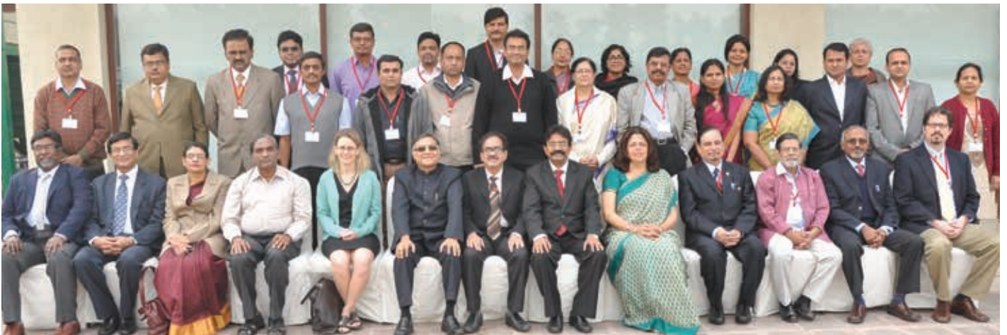
दो दिवसीय राष्ट्रीय कार्यशाला दिल्ली, 2014 में भाग लेने वाले राष्ट्रीय और अंतर्राष्ट्रीय विशेषज्ञ