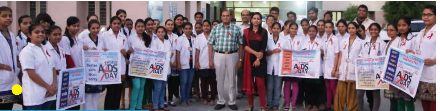
विश्व एड्स दिवस समारोह में सहभागी