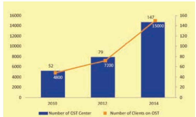
ओ एस टी केन्द्रों की संख्या और ओ एस टी कार्यक्रम के तहत रोगियों की कवरेज

ओएसटी, रोगियों को शारीरिक रूप से और मानसिक रूप से स्थिर करता है जिससे सही ढंग से सोचने की उनकी क्षमता में सुधार होता है और उन्हें पूर्ण स्वस्थता प्राप्त करने के लिए और समाज में पुनः शामिल होने के लिए अन्य जीवनशैली संबंधी परिवर्तनों अनुरूप ढालती हैं।