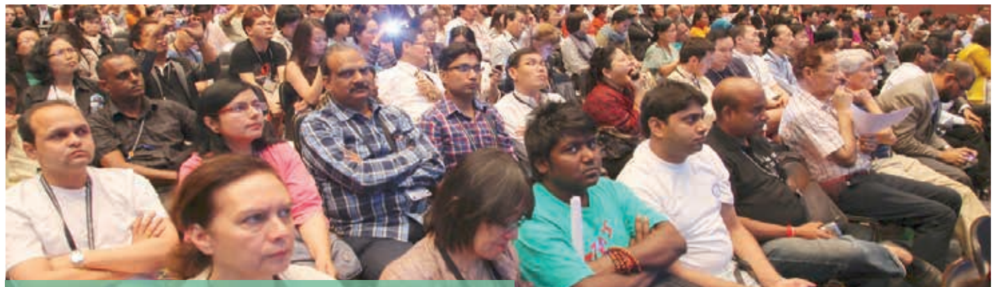
DAC Participants with other international delegates at ICAAP, Thailand