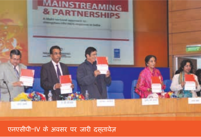
एनएसीपी-IV के अवसर पर जारी दस्तावेज़

उच्च जोखिम समूहों के लिए आईईसी सेवाओं में विस्तार करना और (4) राष्ट्रीय, राज्य और जिला स्तरों पर क्षमता निर्माण करना तथा (5) कार्यनीतिपरक सूचना प्रबंधन प्रणाली (एसआईएमएस) का सुदृढीकरण करना।