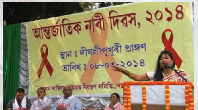
असम राज्य एड्स नियंत्रण सोसाइटी के अंतर्राष्ट्रीय महिला दिवस समारोह पर प्रसिद्ध वक्तागण