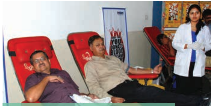
स्वैच्छिक रक्तदान दिवस के अवसर पर सचिव, एड्स नियंत्रण विभाग ने एड्स नियंत्रण विभाग के अधिकारियों के साथ रक्त दान किया