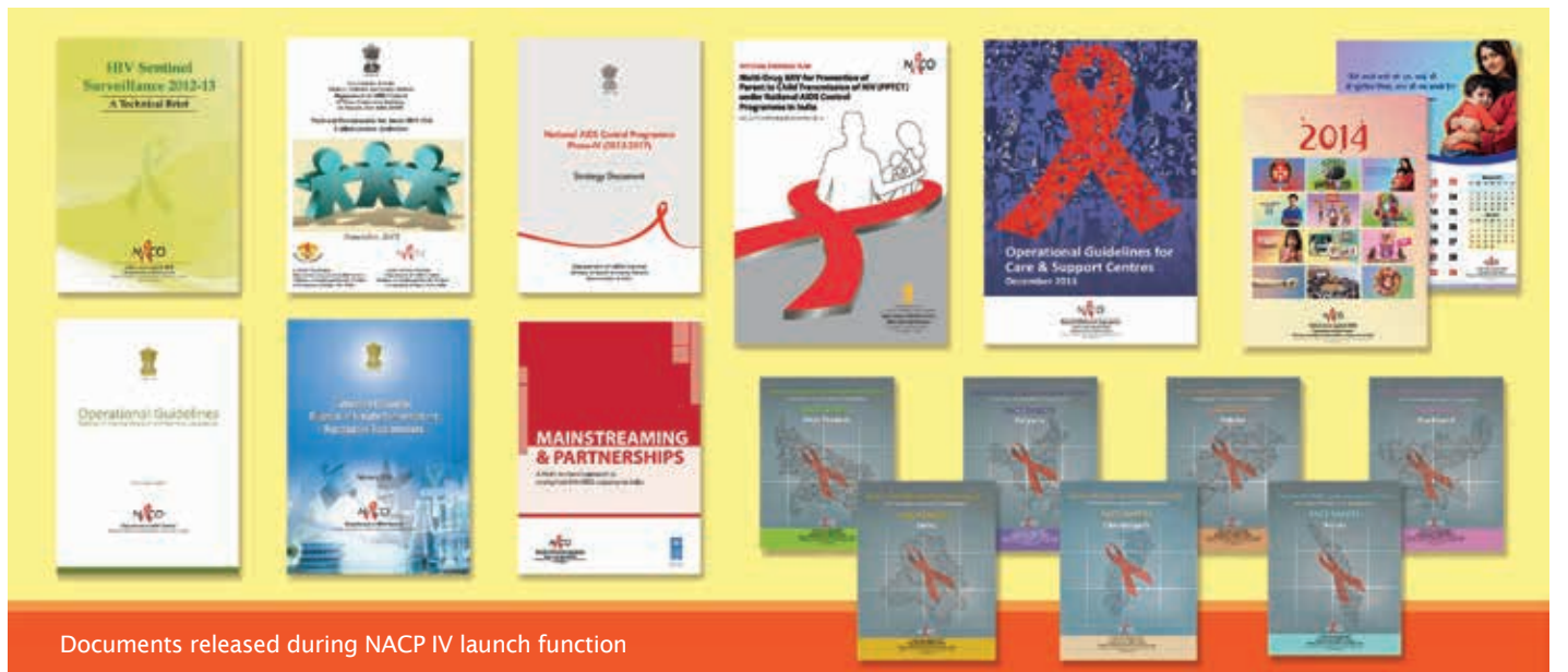
Documents released during NACP IV launch function