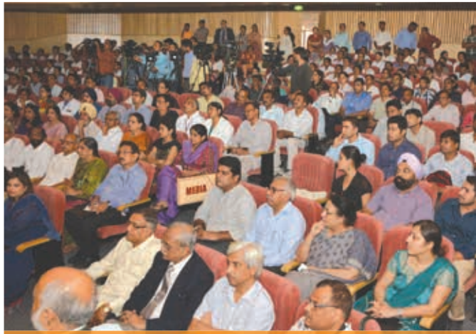
सभागार में उपस्थित विकास भागीदारों, सीएसओ व गैर सरकारी संगठनों के प्रतिनिधि तथा विभिन्न सरकारी विभागों के अधिकारीगण

एनएसीपी-III (2007-2012) के दौरान प्राप्त उपलब्धियों को सुदृढ करते हुए, राष्ट्रीय एड्स नियंत्रण कार्यक्रम के चरण-IV (2012-17) का लक्ष्य अगले पांच वर्षों के दौरान एक सतर्क एवं सुपरिभाषित एकीकरण प्रक्रिया के माध्यम से प्रतिवर्तन की प्रक्रिया में तेजी लाना तथा भारत में महामारी प्रतिक्रिया को और सुदृढ करना है। एनएसीपी-IV का लक्ष्य, उच्च जोखिम समूहों और संवेदनशील जनसंख्या पर फोकस करते हुए, व्यापक परिचर्या, समर्थन और उपचार सेवाओं की सुगमता में वृद्धि करते हुए तथा उसे बढ़ावा देते हुए निवारण सेवाओं में तीव्रता लाना और उन्हें सुदृढ करना है।