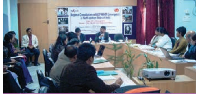
क्षेत्रीय परामर्श में 8 पूर्वोत्तर राज्यों के सदस्य

भारत के उत्तर-पूर्वी क्षेत्रों में विषम परिस्थितियां हैं। भारत सरकार के माध्यम से विभिन्न शीर्ष कार्यक्रमों के तहत इन क्षेत्रों में स्वास्थ्य परिचर्या सेवा प्रदानगी में बाधा आती है। इन 8 राज्यों में से सात राज्यों में ये बाधाएं व विषम परिस्थितियां हैं। इनमें पर्वतीय और दुर्गम क्षेत्र, सीमित संसाधन, सीमित सड़क-रेल-वायु संपर्क और पांच देशों (नेपाल, भूटान, चीन, म्यांमार व बांगलादेश) के साथ लगी अंतर्राष्ट्रीय सीमाएं हैं। जब सभी 8 उत्तरपूर्वी राज्यों के उप जिला स्तरों पर सेवा प्रदानगी प्रक्रिया को मुख्यधारा में लाने के प्रयास होते हैं राष्ट्रीय एड्स नियंत्रण कार्यक्रम (एनएपीसी) और राज्यों की सामान्य स्वास्थ्य प्रणाली के मध्य समाभिरूपता में भी चुनौतियां आती हैं। इन चुनौतियों के समाधान के प्रयासों में 5 फरवरी, 2014 को भारतीय उत्तर पूर्वी क्षेत्रीय कार्यक्रम में क्षेत्रीय संसाधन केन्द्र उत्तर पूर्वी राज्य (आरआरसी-एनईएस) स्वास्थ्य एवं परिवार कल्याण मंत्रालय के समन्वय से 8 उत्तर पूर्वी राज्यों के लिए एनएसीपी और एनएचएम के मध्य समाभिरूपता पर चर्चा आयोजित की गई थी। जब वर्ष 2014-15 के लिए संबंधित राज्यों के पीआईपी और एएपी के क्रियाकलाप की तैयारी की गई थी तब इसका उद्देश्य योजना प्रक्रिया और क्रियान्वित पश्चात कार्यनीति को मुख्य धारा में लाना था।