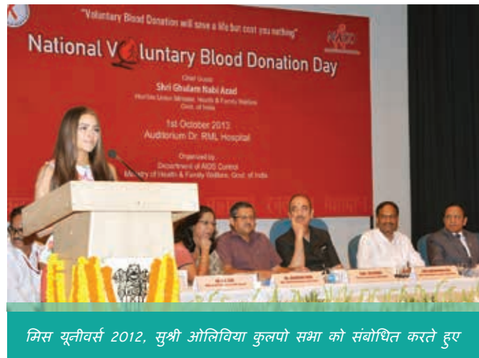
मिस यूनीवर्स 2012, सुश्री ओलिविया कुल्पो सभा को संबोधित करते हुए

किया। इस अवसर पर बोलते हुए और वीडियो के महत्व पर बल देते हुए श्री आजाद ने कहा कि भारत एक बहु-धर्मी और बहुजातीय देश है तथा स्वैच्छिक रक्त एकत्रीकरण में एड्स नियंत्रण विभाग की भूमिका के बारे में बताया।