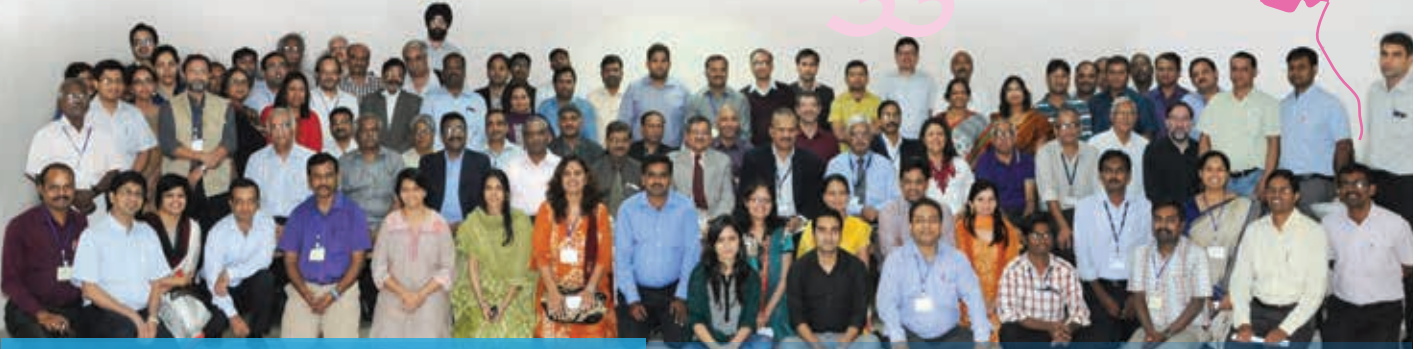
सचिव, एड्स नियंत्रण विभाग; परियोजना निदेशक, पुडुचेरी एड्स नियंत्रण सोसाइटी व अन्य अधिकारीगण

एनएसीपी-IV के अंतर्गत राष्ट्रीय डेटा विश्लेषण योजना (एनडीएपी) की शुरुआत एड्स नियंत्रण विभाग में डेटा विश्लेषण और प्रसार इकाई द्वारा की गयी थी। इस योजना की शुरुआत कार्यक्रम के तहत अधिक संख्या में सृजित आंकड़ों का विश्लेषण तथा साक्ष्य आधारित नियोजन और कार्यक्रम प्रबंधन की सहायता हेतु विश्लेषणात्मक रिपोर्ट तैयार करने की दृष्टि से की गई थी। देश के विभिन्न अनुसंधान संस्थानों, मेडिकल कॉलेजों, राज्य एड्स नियंत्रण सोसाइटियों से विश्लेषकों और अनुभवी परामर्शदाताओं का चयन कर लिया गया है। एनडीएपी के प्रमोचन और सभी विश्लेषकों व अनुभवी परामर्शदाताओं को एक साथ एक प्लेटफार्म पर लाने के लिए 16-18 जनवरी, 2014 के दौरान जीपमेर, पुडुचेरी में कार्यशाला आयोजित की गई थी। सचिव, एड्स नियंत्रण विभाग ने विशिष्ट अतिथियों के साथ विदाई समारोह को सुशोभित किया। दौरे के दौरान सचिव ने एमएसएम तथा टीआई एनजीओ से बातचीत की और राज्य संदर्भ प्रायोगशाला