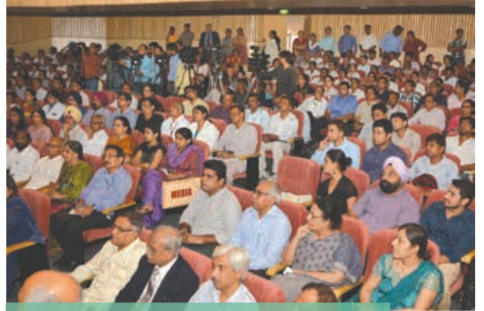
इस अवसर पर उपस्थित अतिथिगण

मिस यूनीवर्स 2012, सुश्री ओलिविया कुल्पो ने समारोह की शोभा बढ़ाई और भारत सरकार को उसके एड्स नियंत्रण कार्यक्रम के लिए सराहना की। उन्होंने युवाओं का रक्तदान करने और अधिक जीवन बचाने हेतु आगे आने का भी आहवाहन